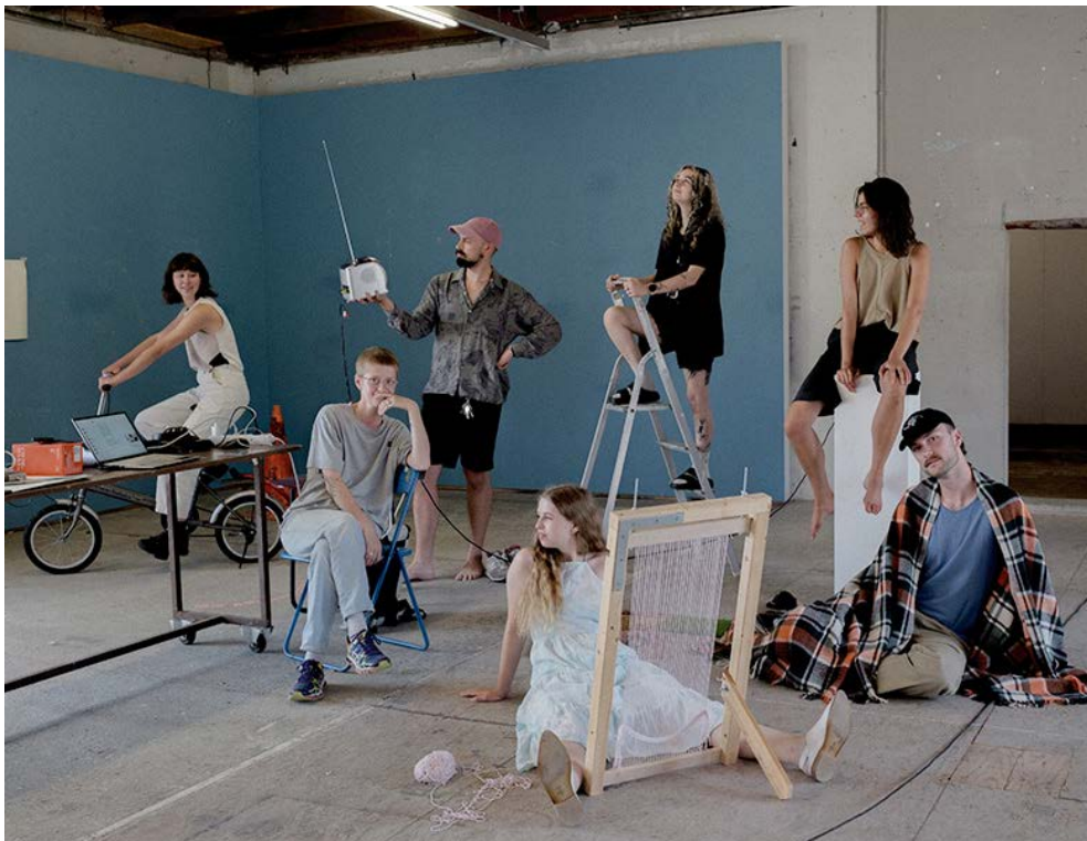
BIJNA StadsGalerij Breda, 2023