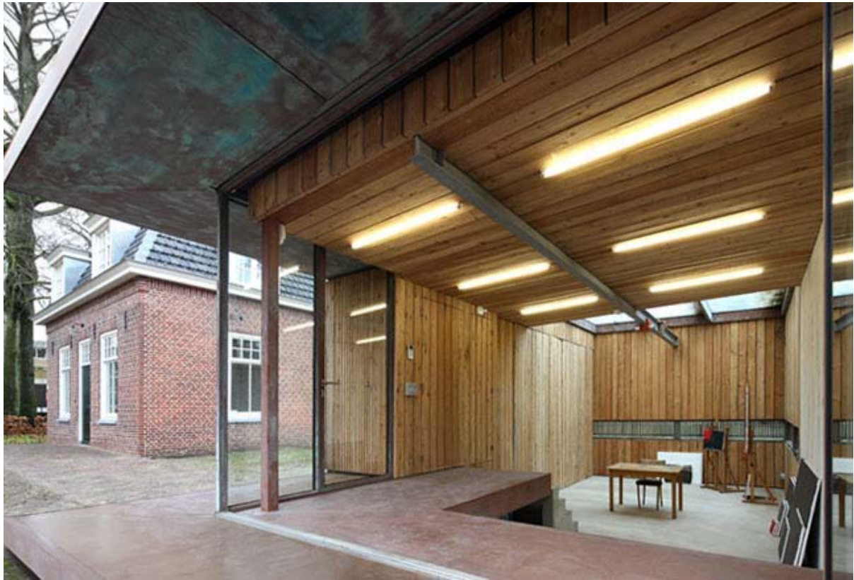
Gastatelier bij de kosterwoning uit Van Goghs tijd, naast de protestantse kerk

Voor 2023 waren de volgende kunstenaars geselecteerd voor een werkperiode van (doorgaans) een maand in het atelier bij de kosterwoning.