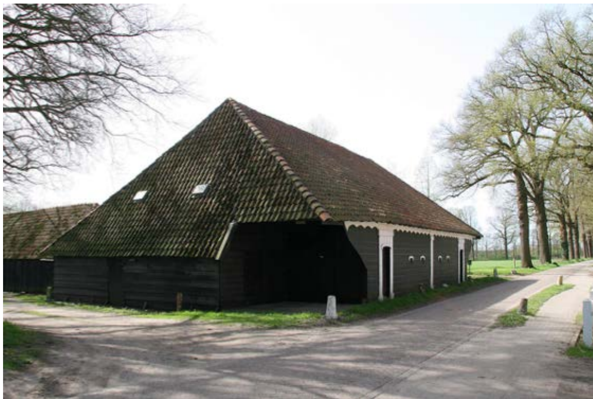
Atelier De Moeren

Op deze locatie worden residentieperioden van twee maanden gehouden, waarbij kunstenaars, schrijvers of curatoren zich verdiepen in Van Gogh en het landschap hier. In de vraagstelling richting kunstenaars wordt met name gefocussed op Van Goghs inspiratie door de natuur.